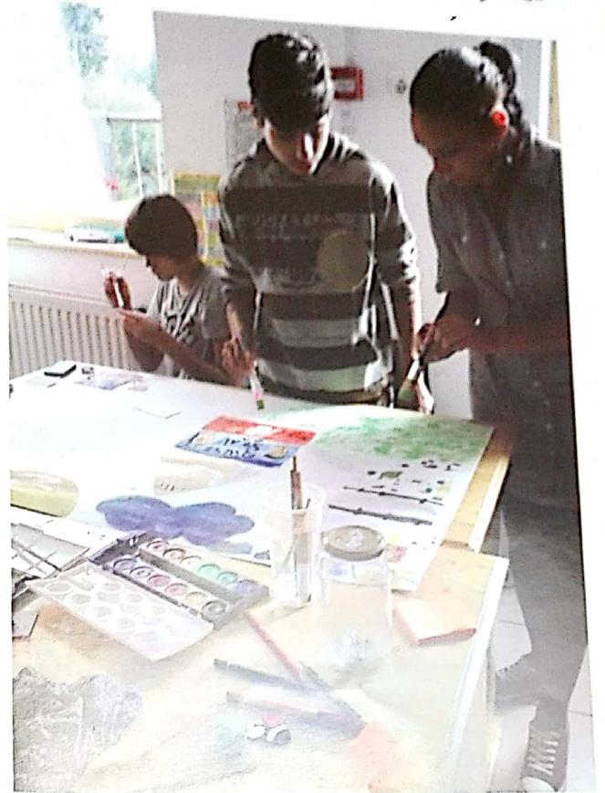
Közösségépítés falfestéssel: A valósítsd meg álmaid! projekt a Hargitán.